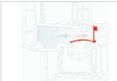
Posizione aletta a pressione normale